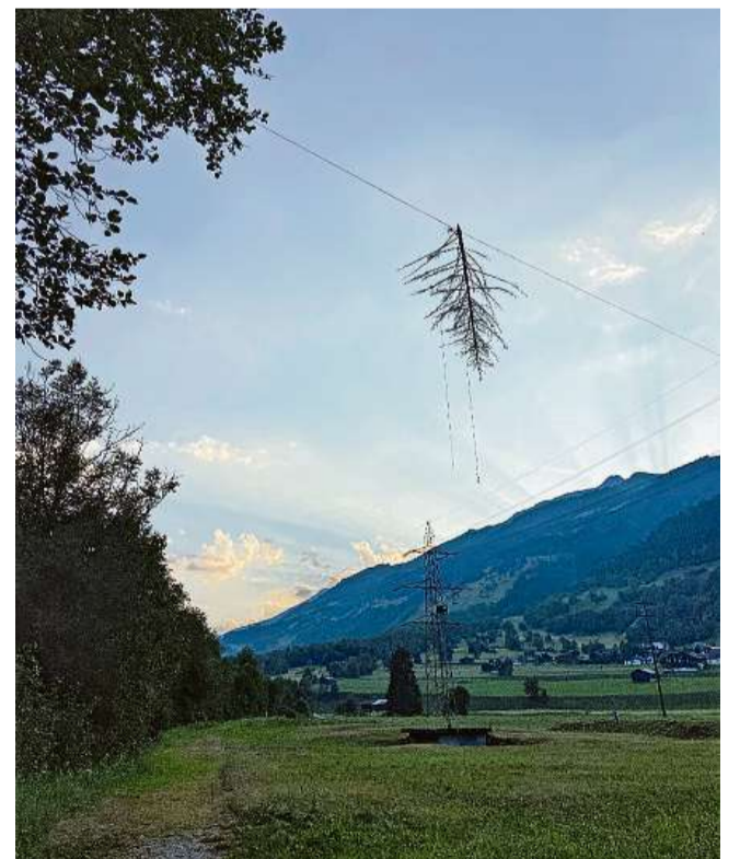
Il pigniel che penda.