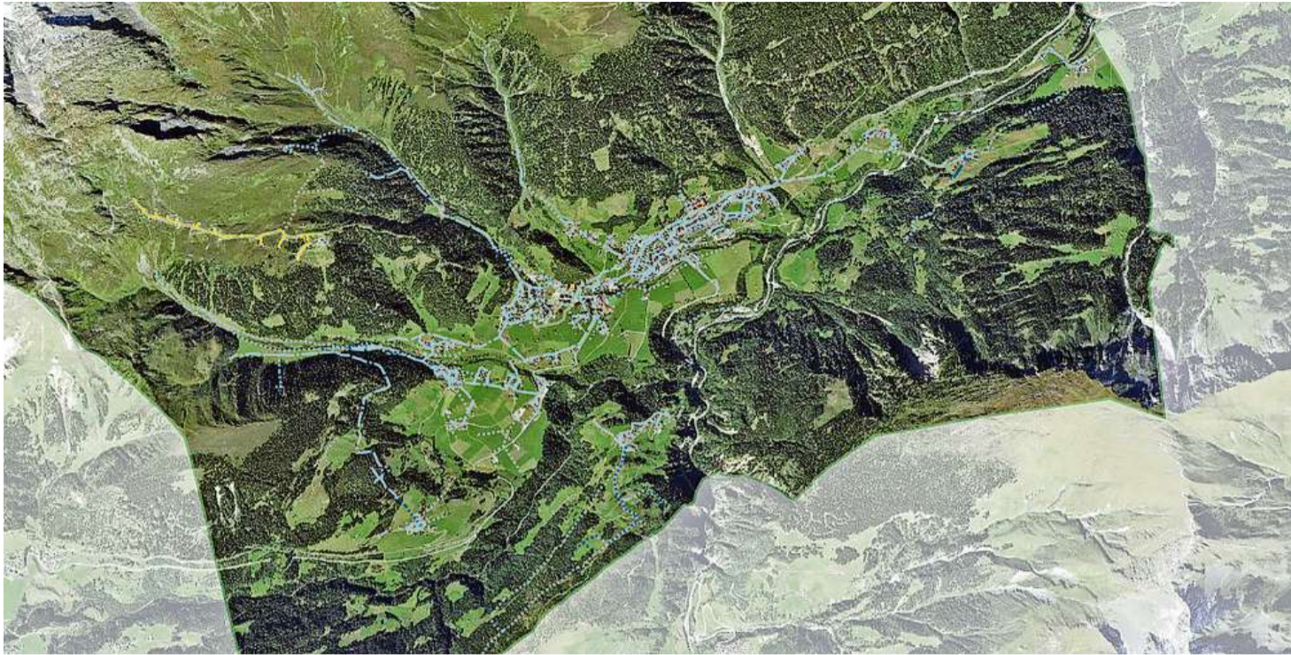
La Corporaziun d'aua Spina da Vin furnescha aua all'entira vischnaunca da Mustér e dapi uonn era a Mompé Medel.