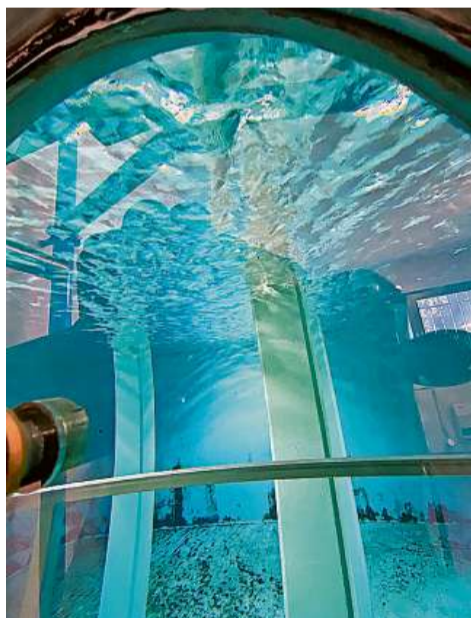
Ils reservuars ein emplen – actualmeins ha ei aua en abundanza a Mustér.