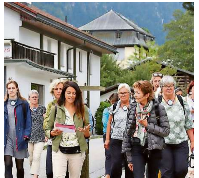
Impressiun dalla davosa spassegiada.